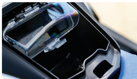
Almacenamiento frontal y compartimento para teléfono estanco Almacenamiento frontal con acceso simplificado para llevar equipamiento extra a bordo. Espacio seguro para teléfono y artículos personales con el compartimento estanco para teléfono.