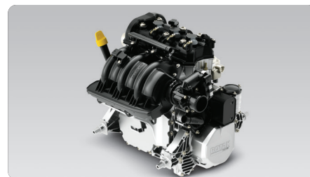
ROTAX® 900 ACE™ - 60 Dos opciones de motor Rotax® ligero, compacto y eficaz en consumo.