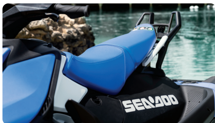
Asiento de perfil estrecho Diseñado para mejorar la libertad de movimiento durante la conducción.