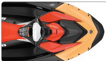
Integración de LinQ™ Lite Rápidamente accesible y ubicado en 5 puntos de la unidad. Gran variedad de accesorios Sea-Doo® LinQ™ Lite.