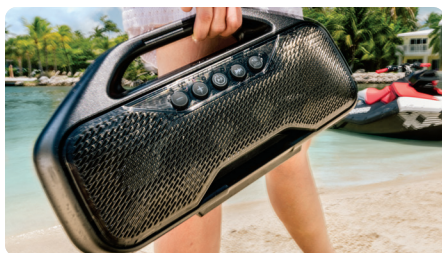
Sistema de audio portátil de BRP (opcional) El sistema de audio portátil de BRP ofrece sonido de calidad superior tanto en el agua como fuera de ella mediante los modos de concierto, conducción y doméstico. Integra soporte de montaje de alto rendimiento.