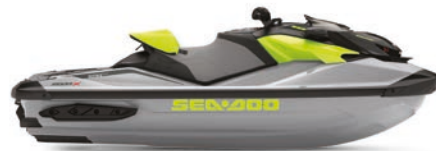
● NUEVO Hielo metalizado / Verde manta