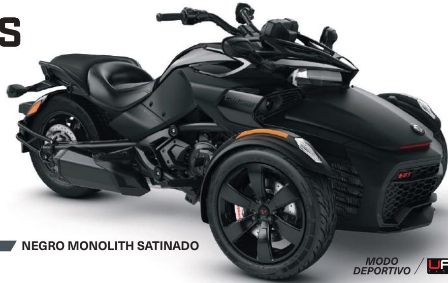
■ NEGRO MONOLITH SATINADO