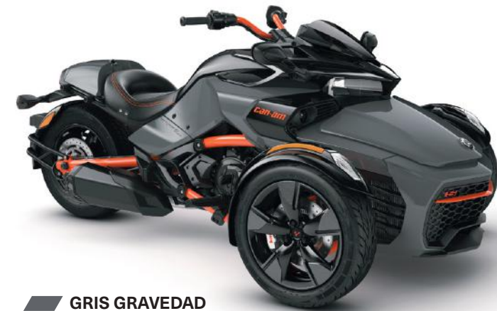
■ GRIS GRAVEDAD SERIE ESPECIAL